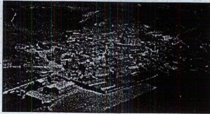
Vista panorámica de Castrillo Tejeriego

—No, sólo parte de ella. Aquí estudian hasta quinto de E.G.B., luego pasan a un centro en una localidad cercana. Para realizar Formación Profesional o BUP, es cuando ya tienen que despla-